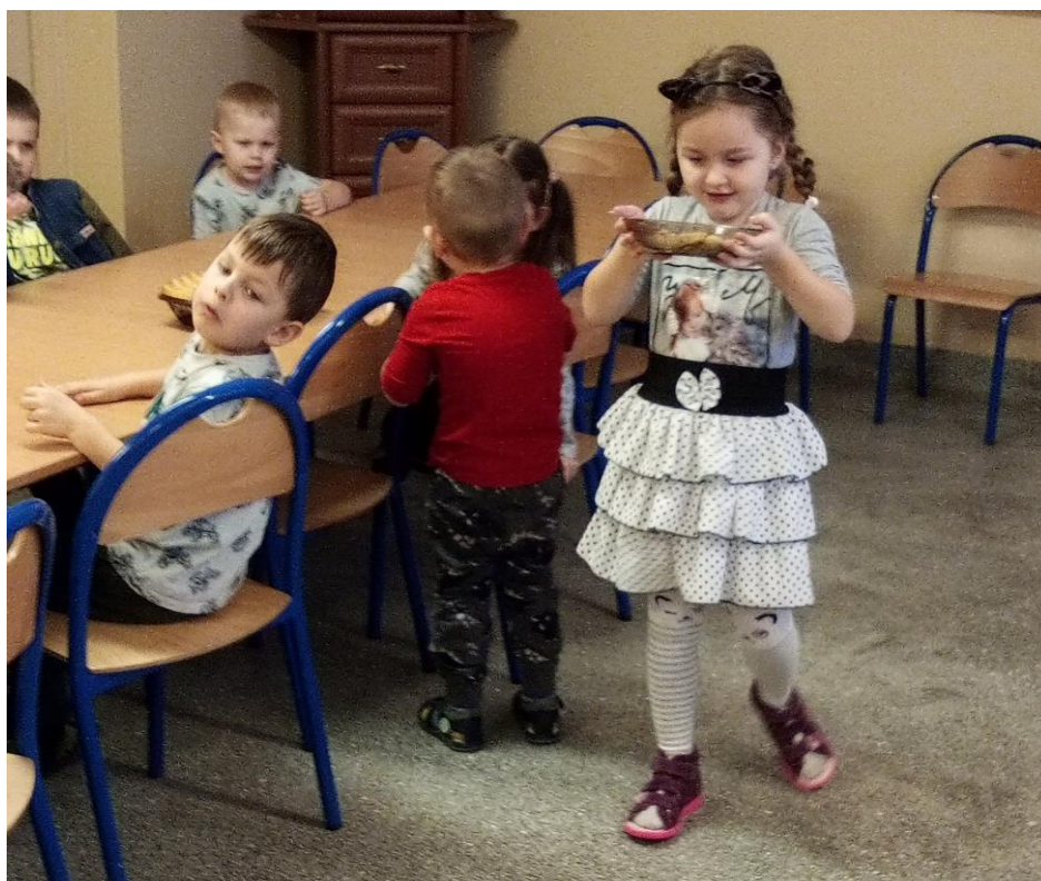
Uczymy się samodzielności.