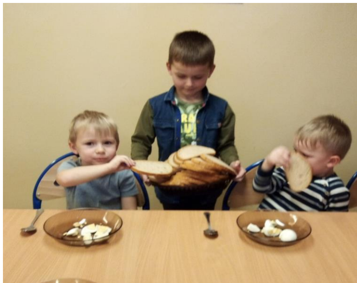
Pełnimy dyżury na stołówce przedszkolnej.