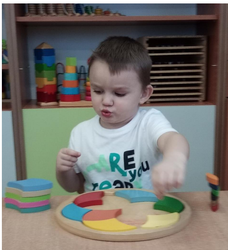
Zawsze uczymy się przez działanie.